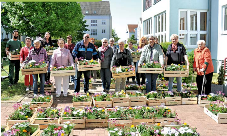
Das eingerichtete immobilienwirtschaftliche Quartiersmanagement trägt Früchte – wie sich an gemeinsamen Aktivitäten der Bewohner beim Gärtnern oder bei Ausflügen zeigt